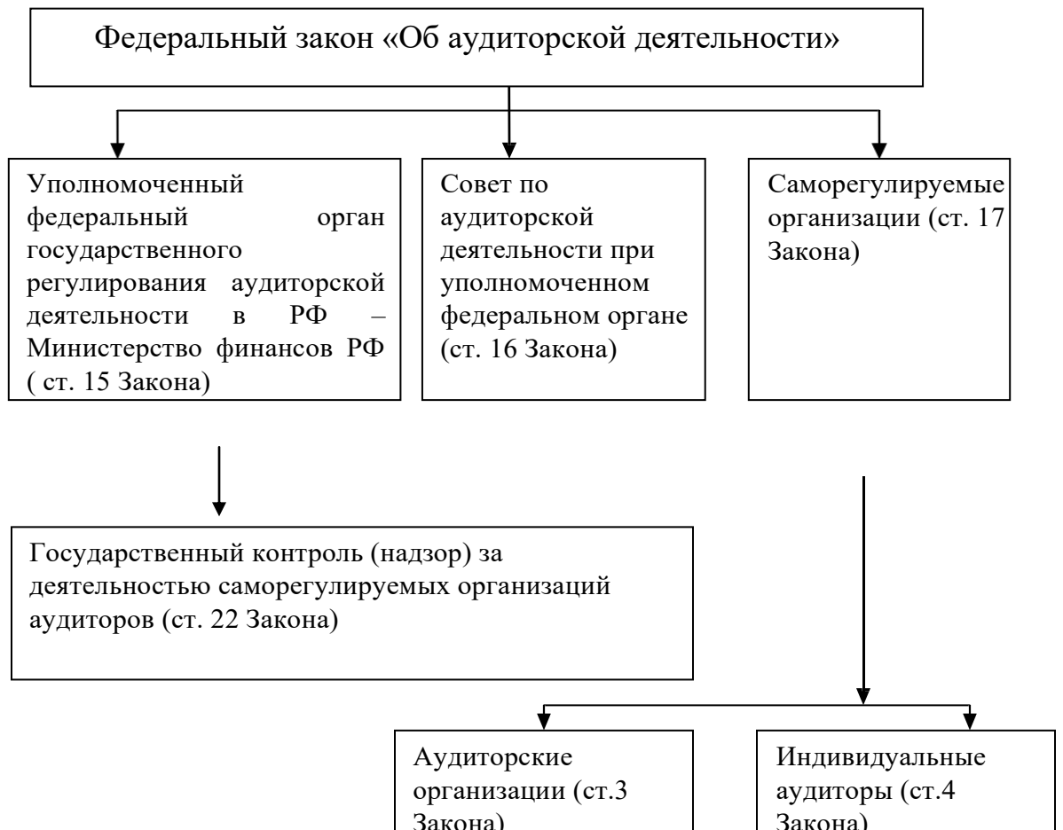
Рисунок 4– Схема организационно-правового регулирования аудиторской деятельности в России