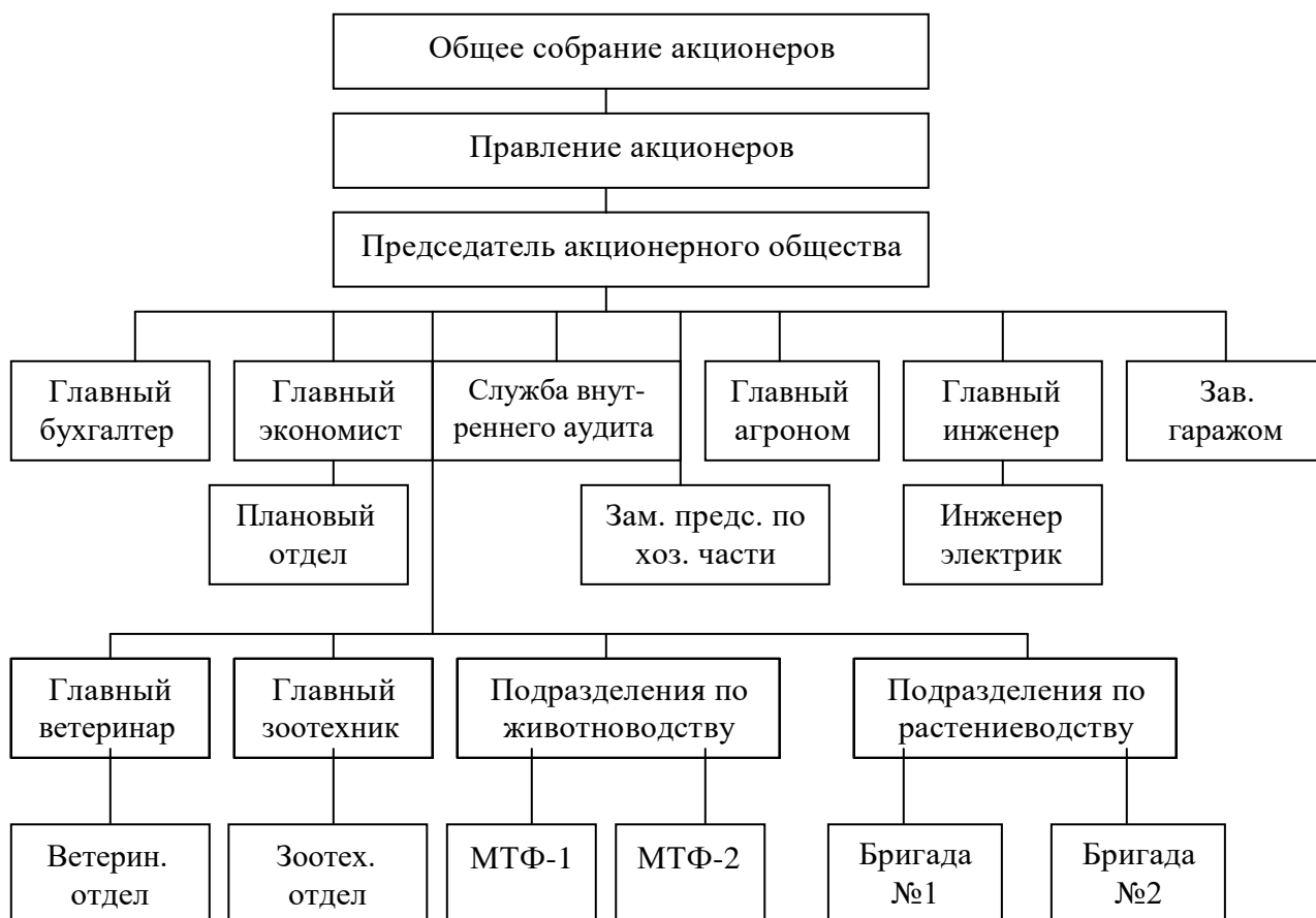
Рисунок 1 - Схема управления сельскохозяйственного СПК колхоз

В организациях, где значительный удельный вес в структуре имущества занимают основные средства, необходимо проанализировать их состав, структуру, физическое состояние, эффективность использования.