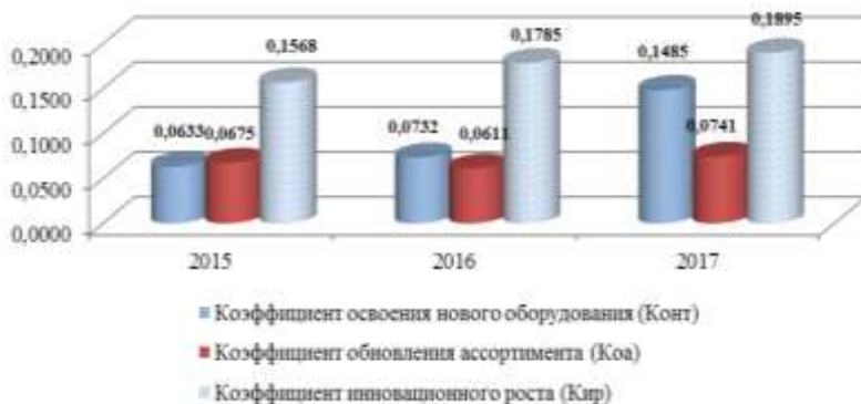
Рисунок 6 - Показатели инновационной активности ЗАО КПК «Ставропольстройопторг»