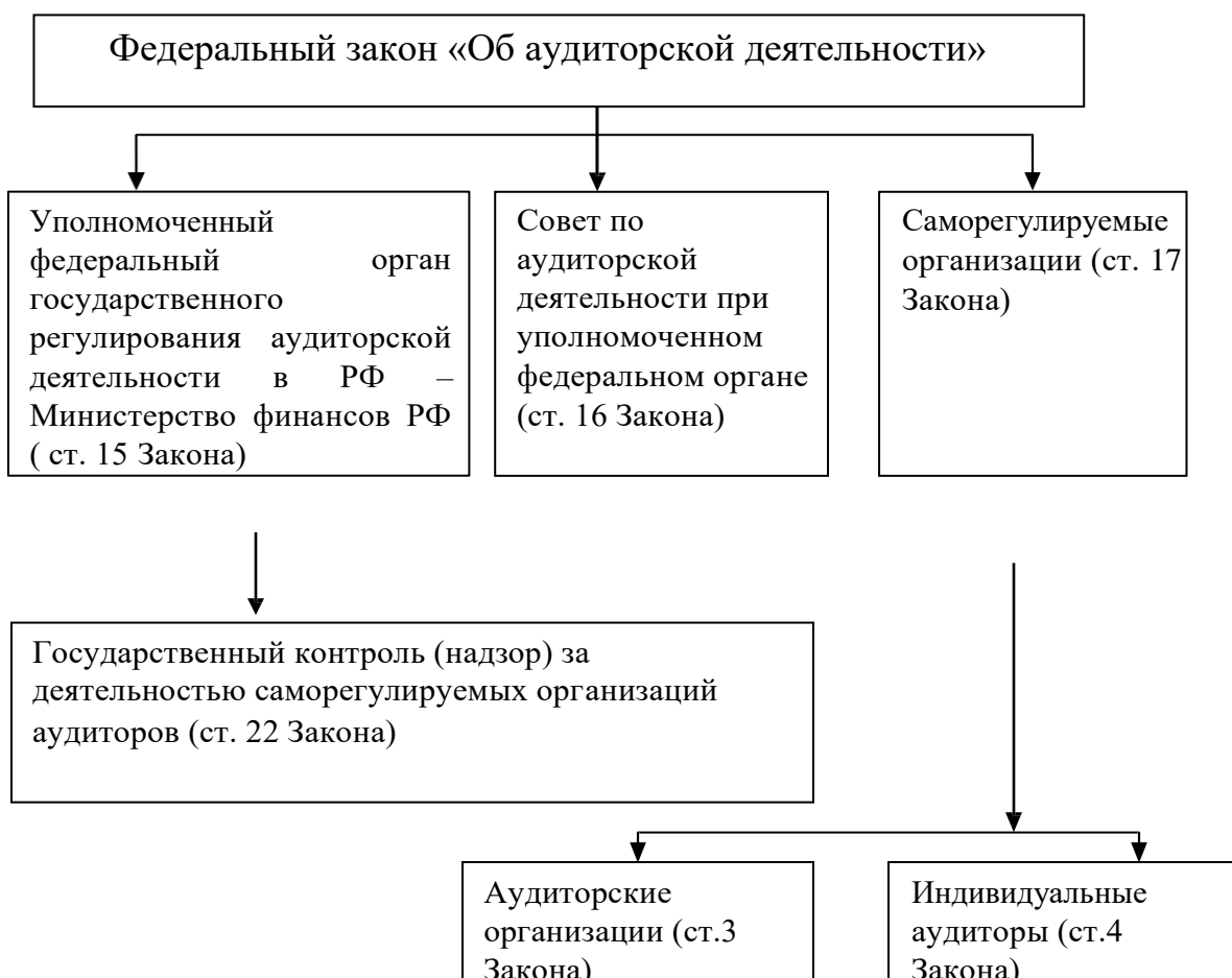
Рисунок 4– Схема организационно-правового регулирования аудиторской деятельности в России