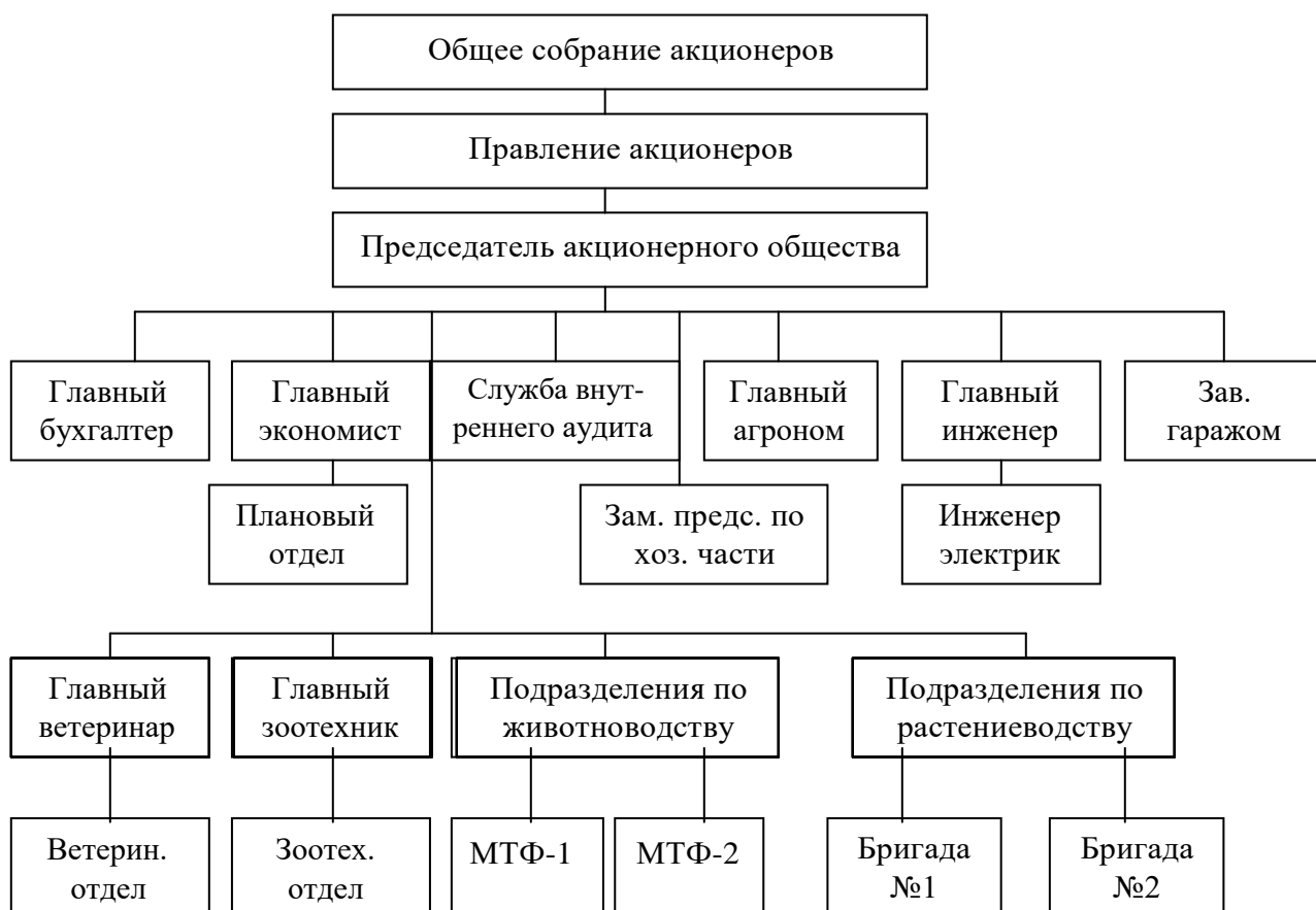
Рисунок 1 - Схема управления сельскохозяйственного СПК колхоз

В организациях, где значительный удельный вес в структуре имущества занимают основные средства, необходимо проанализировать их состав, структуру, физическое состояние, эффективность использования.