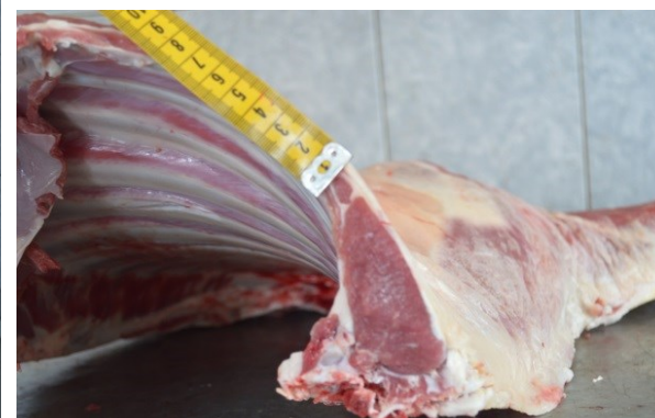
Рисунок 5 – Туша, полутуша и поперечный разруб между 12 и 13 грудными позвонками

8 месячного баранчика породного генотипа РММхИДФ