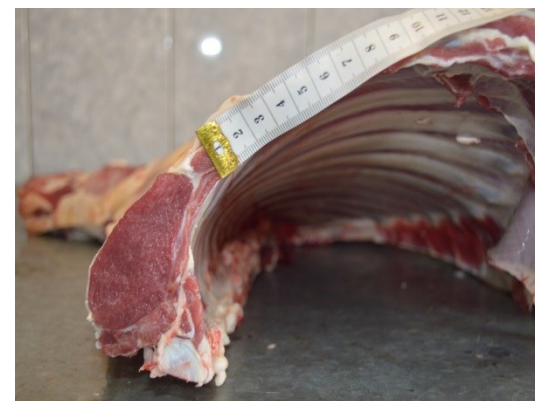
Рисунок 6 – Туша, полутуша и поперечный разруб между 12 и 13 грудными позвонками

8 месячного баранчика породного генотипа ДМхИДФ