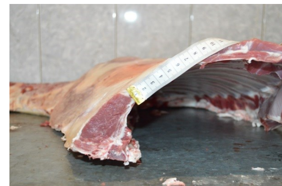
Рисунок 3 – Туша, полутуша и поперечный разруб между 12 и 13 грудными позвонками

8 месячного баранчика породного генотипа РММхШ