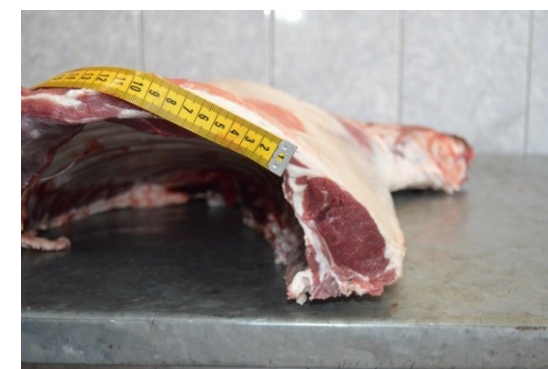
Рисунок 1 – Туша, полутуша и поперечный разруб между 12 и 13 грудными позвонками

8 месячного чистопородного баранчика породы РММ