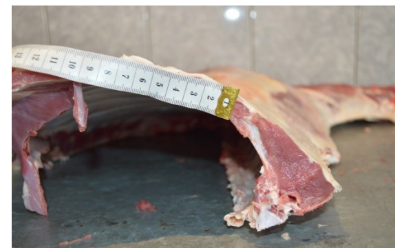
Рисунок 2 – Туша, полутуша и поперечный разруб между 12 и 13 грудными позвонками

8 месячного чистопородного баранчика породы ДМ