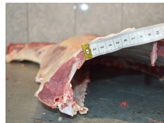
Рисунок 4 – Туша, полутуша и поперечный разруб между 12 и 13 грудными позвонками

8 месячного баранчика породного генотипа ДМ хШ