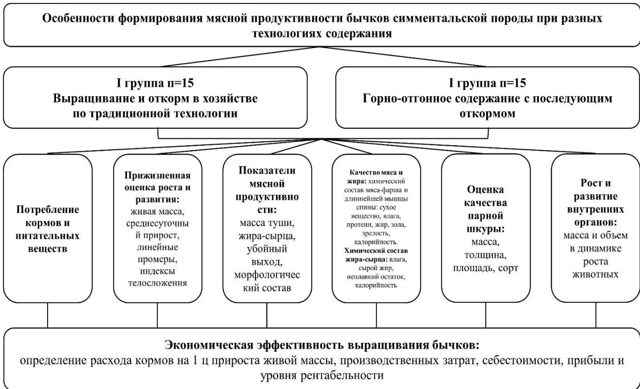
Рисунок 1 – Схема опыта