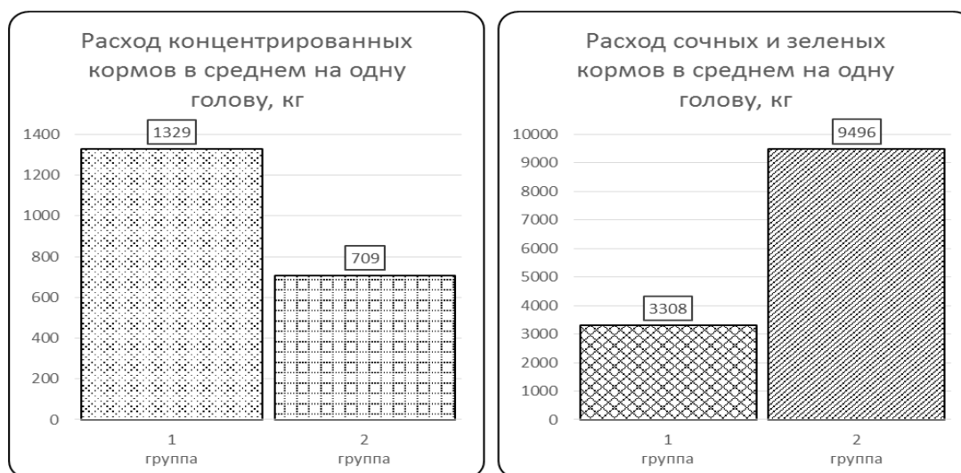
Рисунок 2 – Соотношение кормов в рационах кормления бычков симментальской породы

Анализ полученных данных показывает, что молодняк опытной (II) группы, содержащийся в весенне-летний период на высокогорных пастбищах, потребил 3304,0 кг зеленой травы. Это кардинально изменило соотношение типов кормов в рационе (рисунок 2).