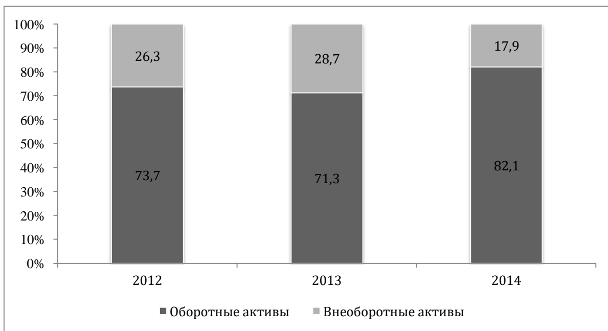
Рисунок 2 – Структура имущества ООО «Меценат» в 2012–2014 гг.