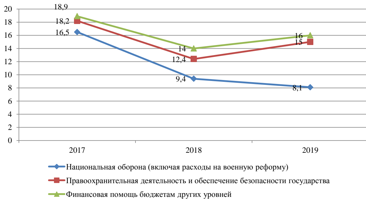
Рисунок 3 – Структура расходов федерального бюджета в 2017–2019 годах (в % от всех доходов).