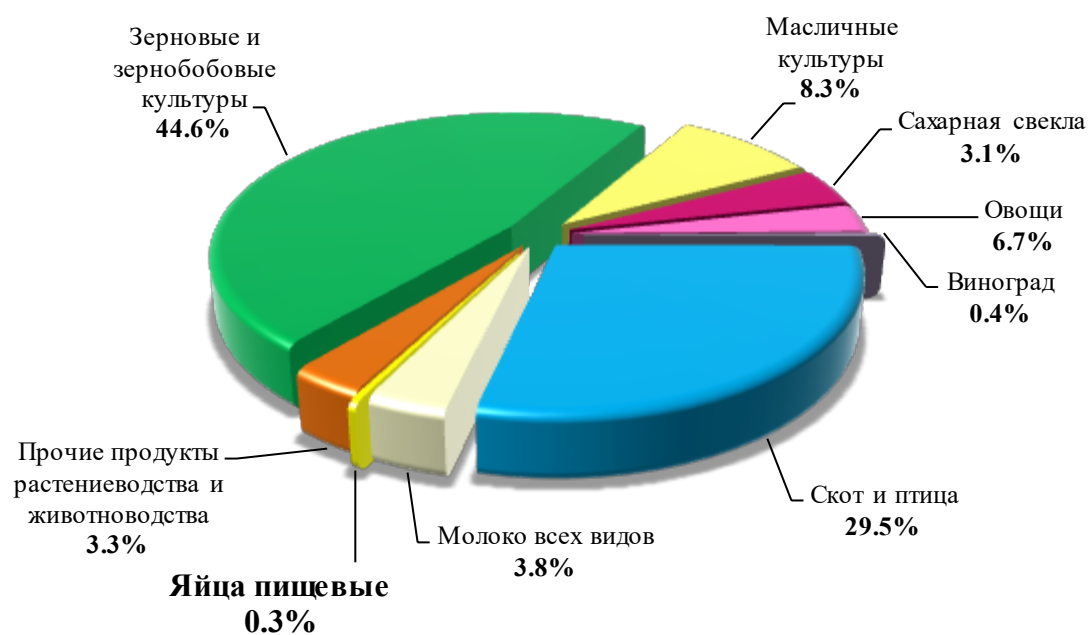
Рисунок 2 - Структура выручки от реализации продукции в ООО «Импульс» в 2018 году, %