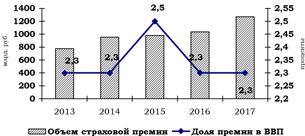
Рисунок 2 – Динамический ряд страховых премий страховщиков России

Надписи под рисунками следует размещать горизонтально, без рамок, вблизи элемента, к которому они относятся. Каждый рисунок должен иметь краткое содержательное название, которое помещается под рисунком. Подпись названия начинается с заглавной буквы, в конце точка не ставится, например: