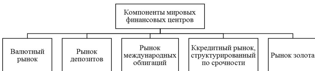
Рисунок 2 - Основные компоненты мировых финансовых центров

Особую наглядность и выразительность отдельным характеристикам магистерской диссертации придает иллюстрированный материал: диаграммы, графики, компьютерные распечатки, рисунки, фотографии и т. д. Все эти иллюстрации именуется «рисунками» и нумеруются арабскими цифрами по всей работе сквозным порядком, отдельно от нумерации таблиц.