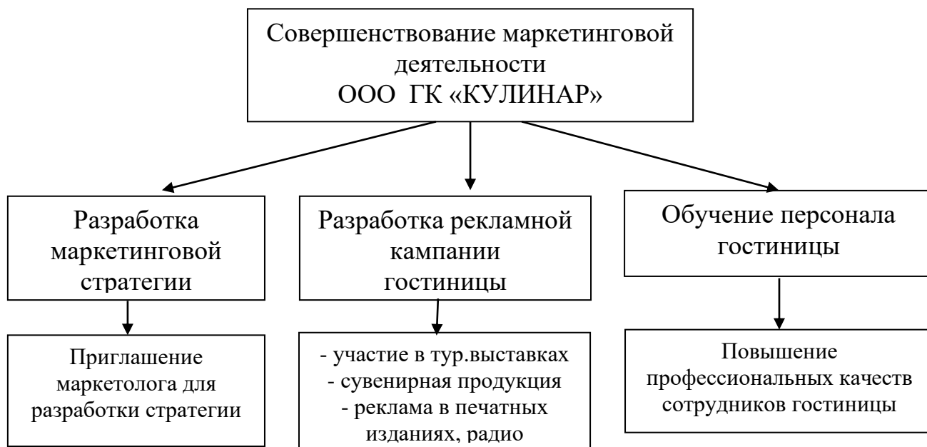
Рисунок 1 – Мероприятия по совершенствованию маркетинговой деятельности ООО ГК «КУЛИНАР»