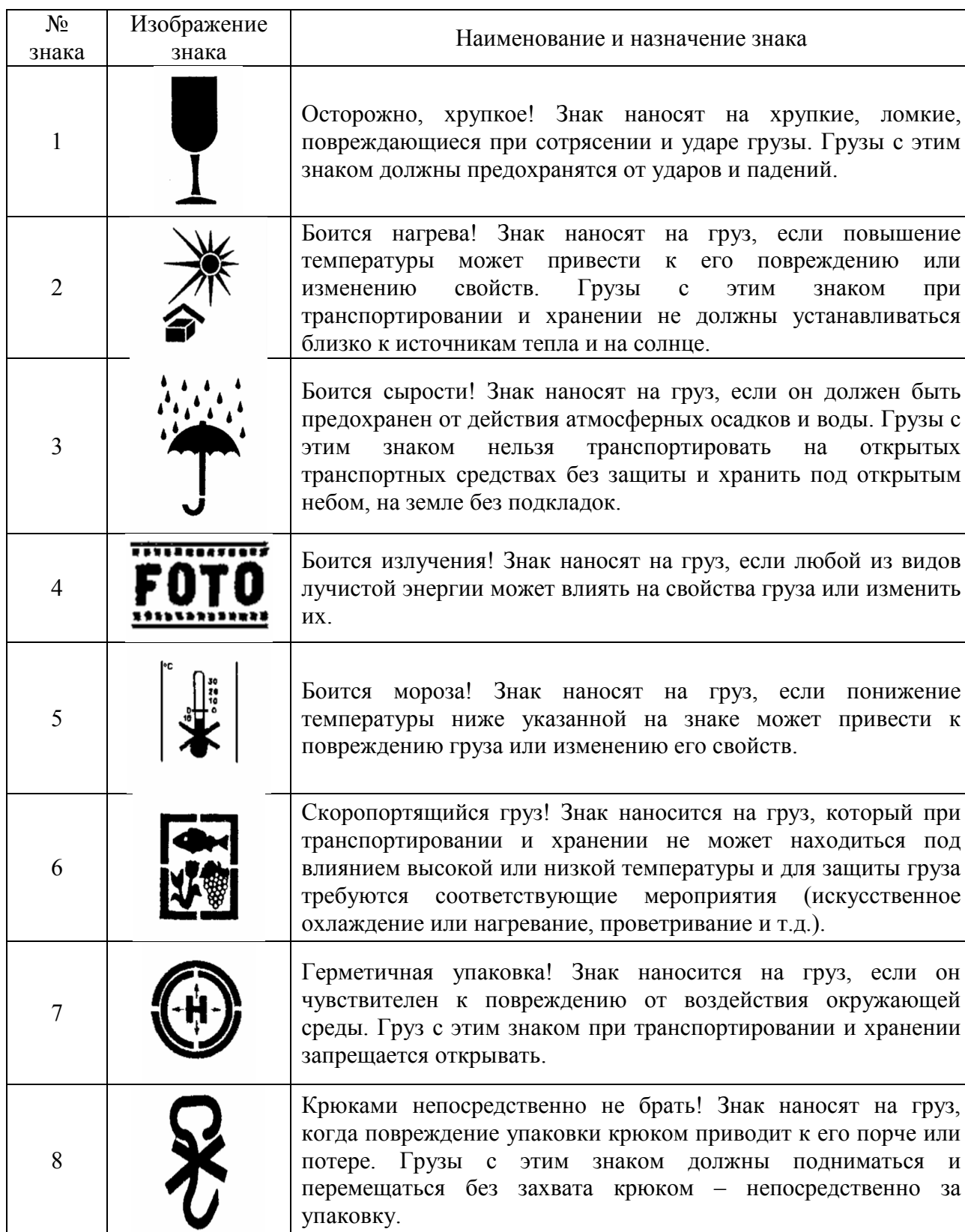
Таблица 1. Манипуляционные знаки

Подберем манипуляционные знаки, изображение и назначение которых должно соответствовать указанному в таблице 1.