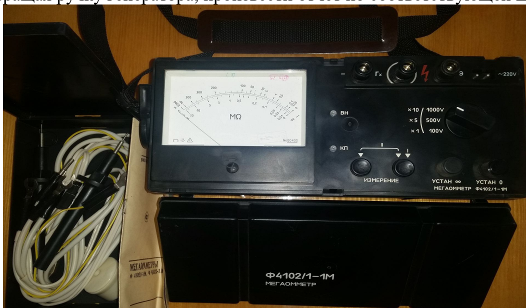
Рисунок 3 – Мегомметр Ф4102/2-1М

- вращая ручку генератора, произвести отчет по соответствующей шкале.