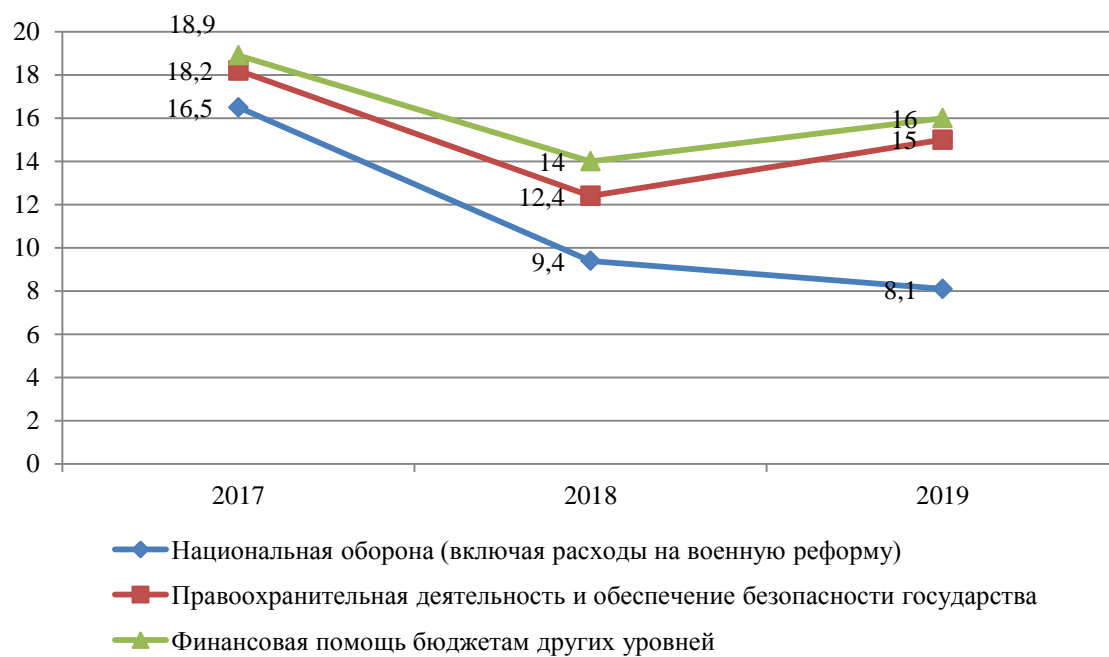
Рисунок 3 – Структура расходов федерального бюджета в 2017–2019 годах (в % от всех доходов).