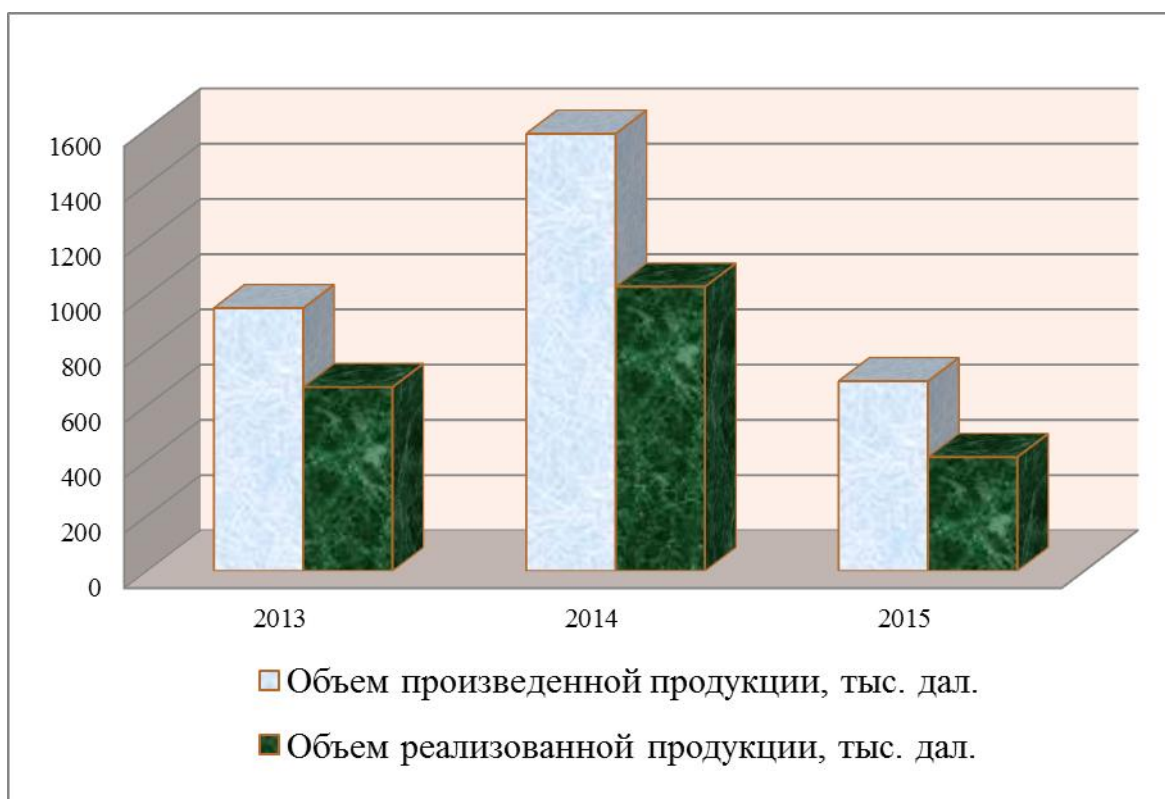
Рисунок 1- Объем произведенной и реализованной продукции ООО «Импульс»