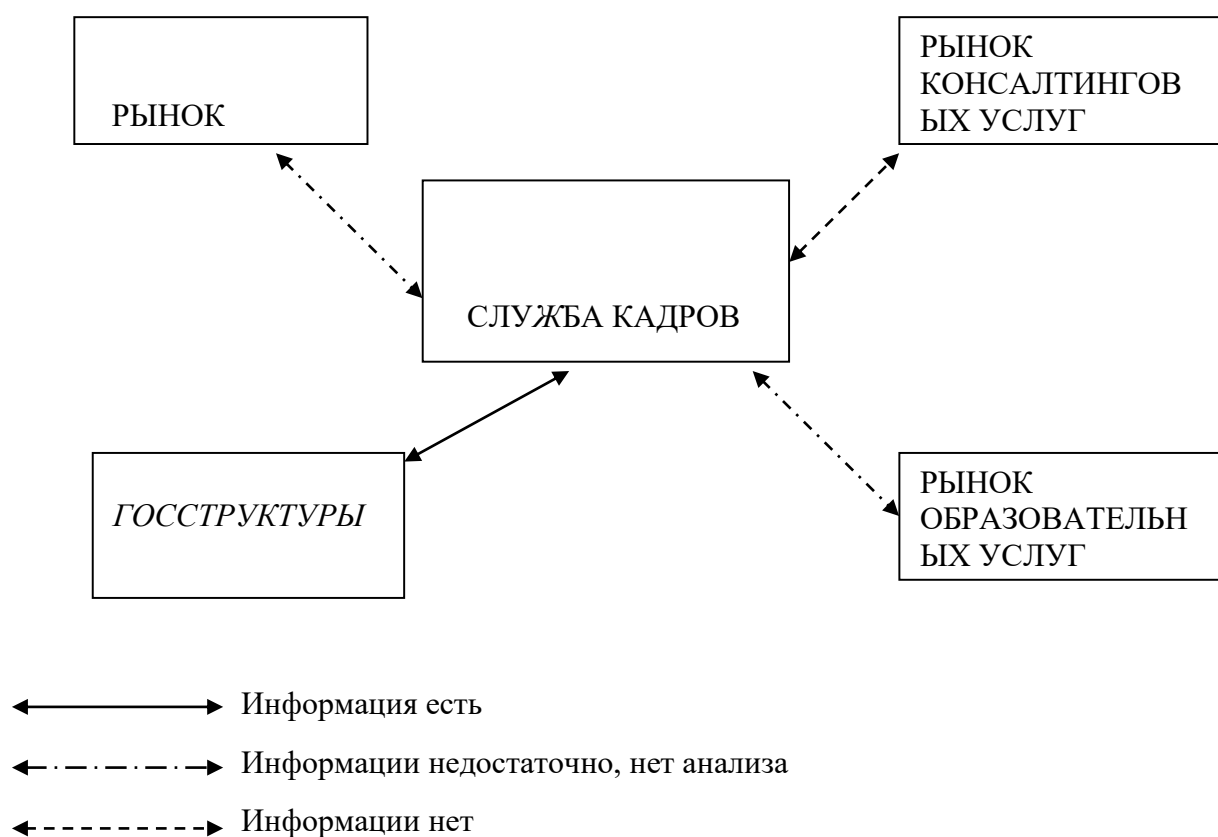
Рисунок 2 - Взаимосвязь отдела кадров с внешней средой